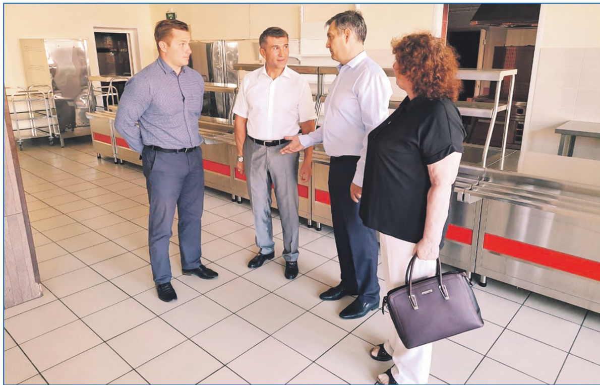
Общественная приемка школы №155

— Какие проблемы больше всего волнуют жителей округа?